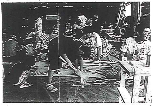
※春日井では 9/24日に 開催します。

大型台風8号接近の情報(確実)に悪天候が予想 されたので、スタッフ一同ずいぶん悩みましたが工作 教室をあてにしている方にとり中止というのは困るだろうという 判断で実施することになりましたが、今回は過去最大の参加 申し込みがあり、屋外作業を避けるため午前と午後に分けて 二部構成とし、BBQは無しとさせていただきます。おかげで 無事に事故や怪我もなく終了することができました。あり かとうございませう。BBQを楽しみにされていた方にはしまと うに申し訳ないかと思っております。来年こそはやりたいたいと思 っていますので是非ご参加ください!