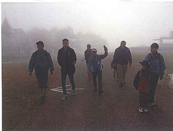
薪ストーブタイマーの歌が流れてきそうないい感じのひとコマ!

いつものイベントの切り口を変えたり、 新たなイベントにも挑戦しました! 『炎の薪割り合宿』や『夏休み工作教室』のBBQ会場を変えてみたり、 新たな試みとして、『DIYイベント』で 塗装や珪藻土塗りをひとつの現場で連続して開催しました。 『位山親子ハイキング』という趣味や暮らしのイベントも開催しました!