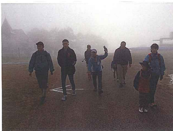
薪ストーブタイマーの歌が流れてきそうないい感じのひとコマ!

いつものイベントの切り口を変えたり、 新たなイベントにも挑戦しました! 『炎の薪割り合宿』や『夏休み工作教室』のBBQ会場を変えてみたり、 新たな試みとして、『DIYイベント』で 塗装や珪藻土塗りをひとつの現場で連続して開催しました。 『位山親子ハイキング』という趣味や暮らしのイベントも開催しました!