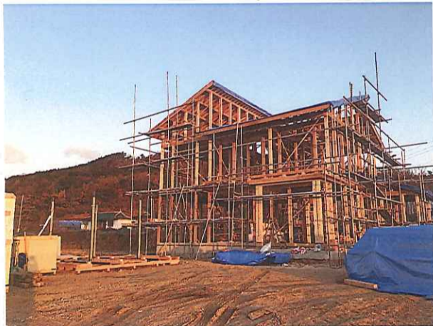
韓国の家は結構大きい! 無事に建てて安心...

営業所がある関係で春日井近郊へは距離感が麻痺してしまっていますが、 今年は、岐阜市や関市にも新築工事をしに行かせてもらいました。(高山の担当者で...) さらには、日本を飛び出し韓国でも家を建てるという快挙を成し遂げました。